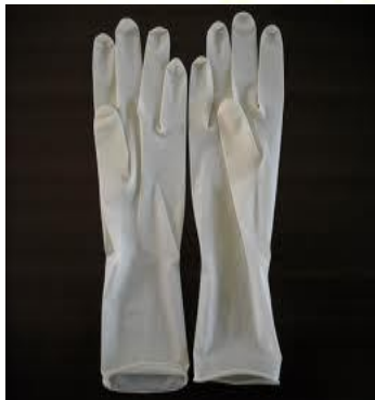
LUVAS DE PROCEDIMENTO