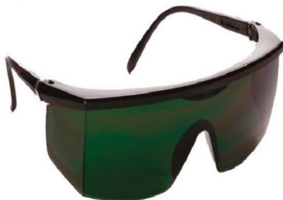
OCULOS DE PROTEÇÃO