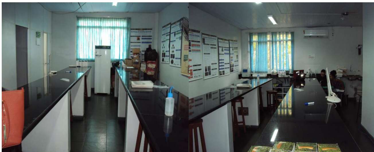
Laboratório de Sementes