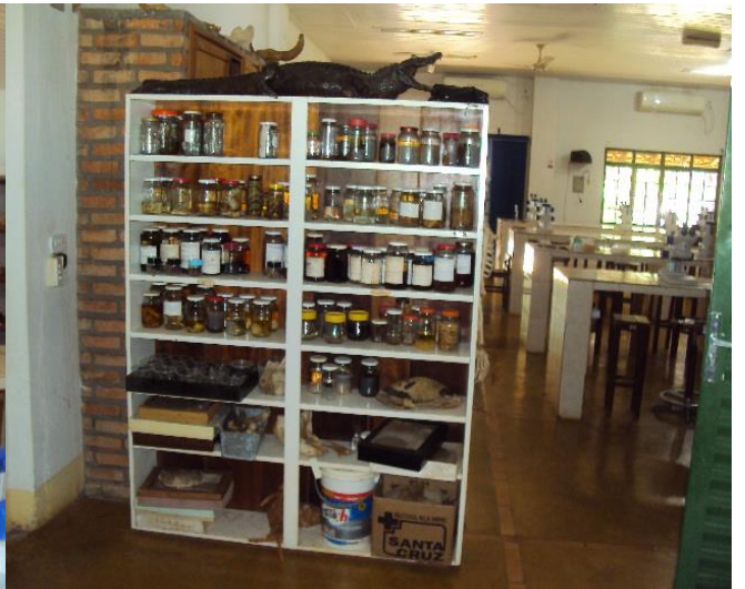
Laboratório de Biologia Geral