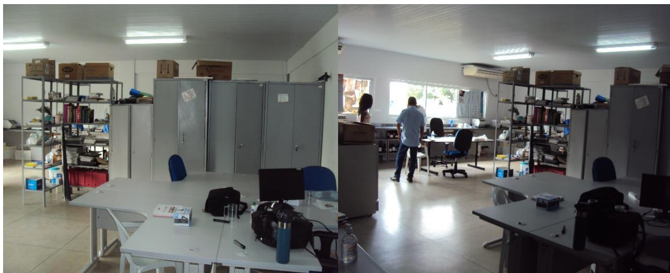
Laboratório de Genética e Biologia Molecular