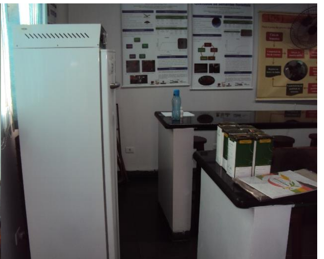
Laboratório de Sementes