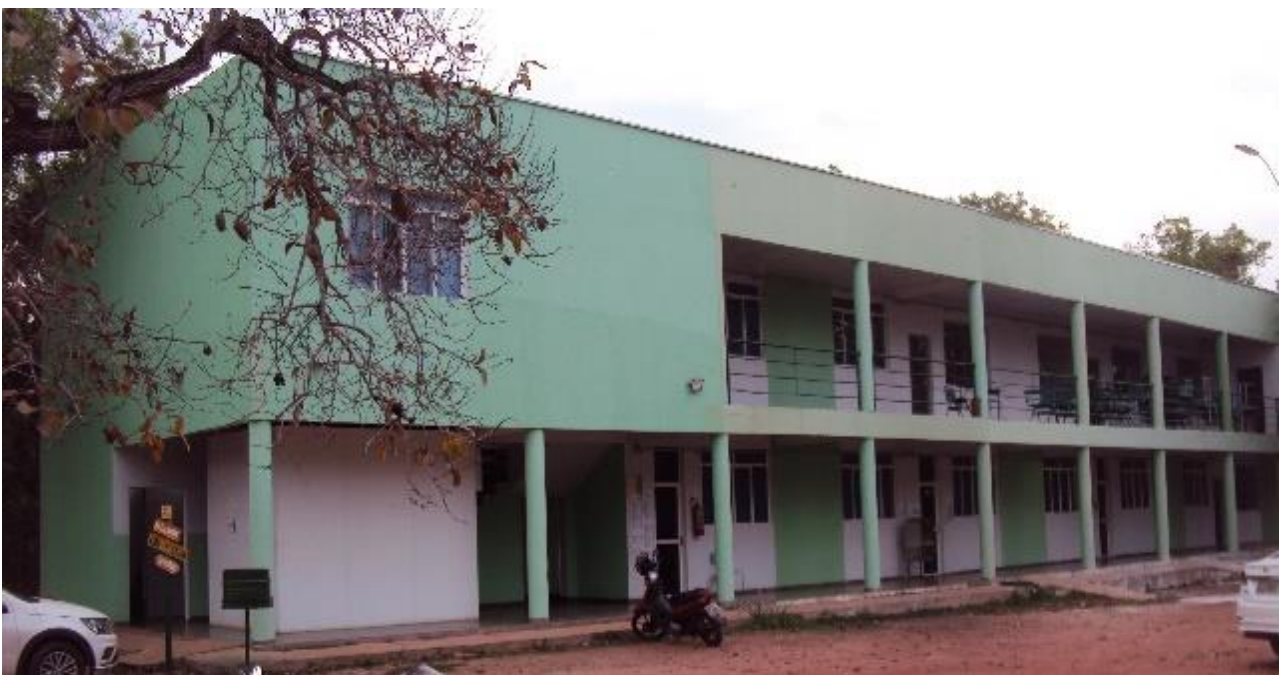
Campus Universitário de Nova Xavantina (Bloco Salas de Aula e Laboratórios)