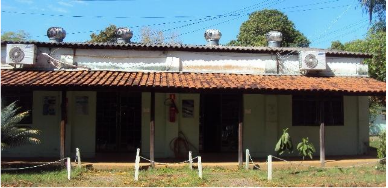
Prédio dos Laboratórios de Química e Biologia