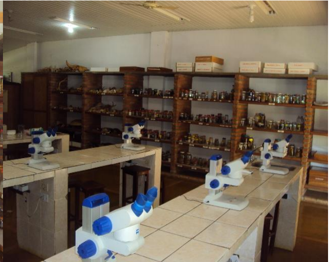
Laboratório de Biologia Geral