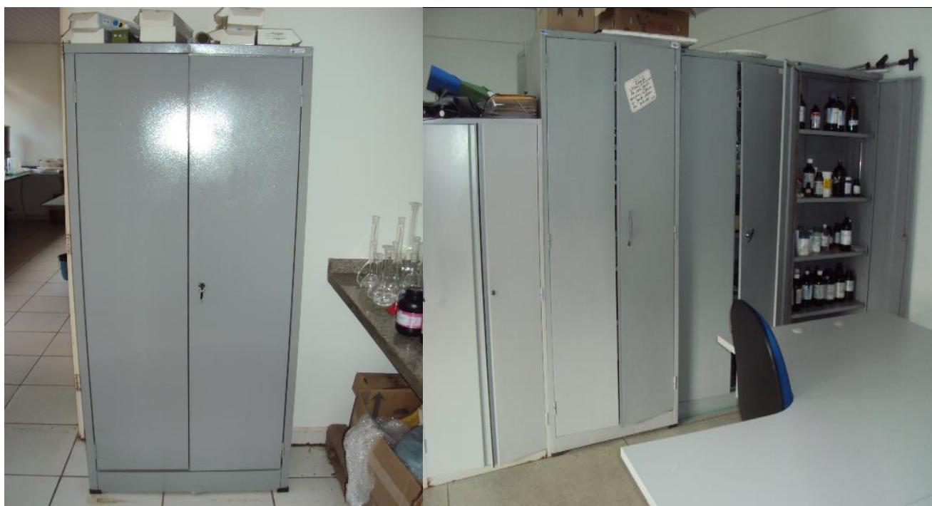
Armários para Produtos Químicos Controlados com Chaves.