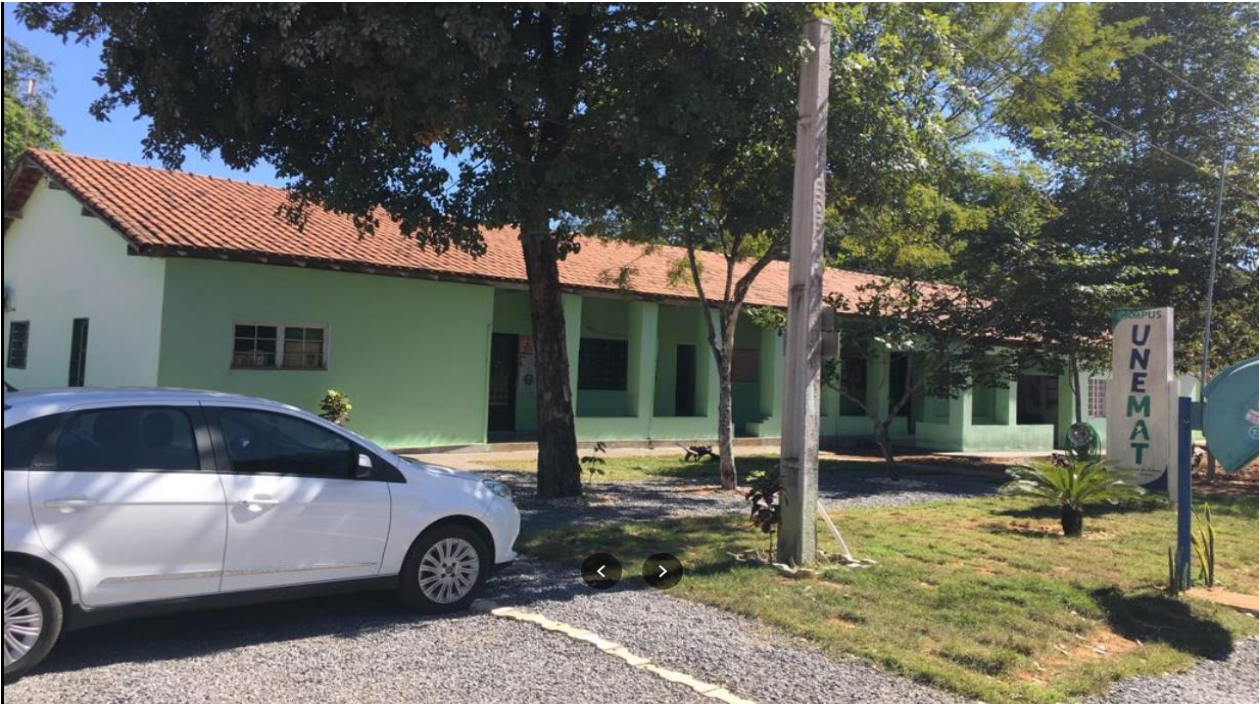
Campus Universitário de Nova Xavantina (Prédio Administrativo)