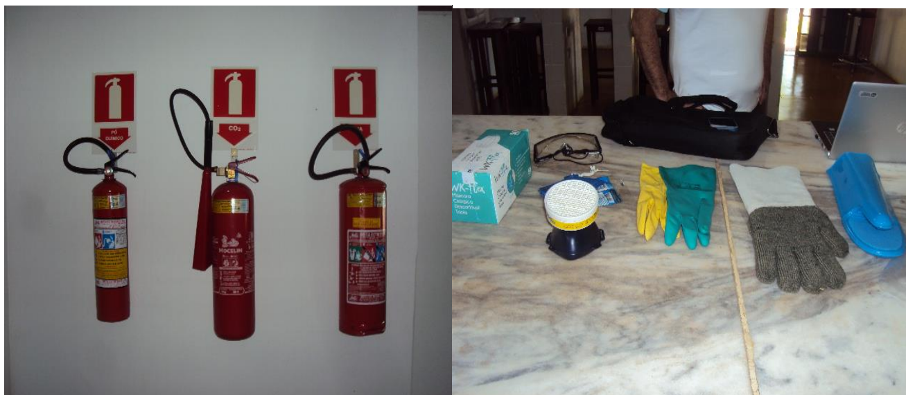
Extintores de Incêndio