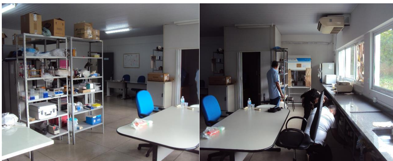
Laboratório de Genética e Biologia Molecular