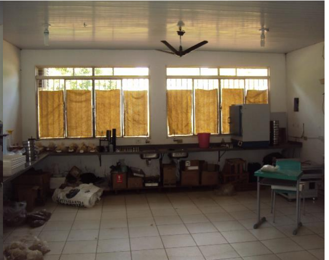
Laboratório de Solos