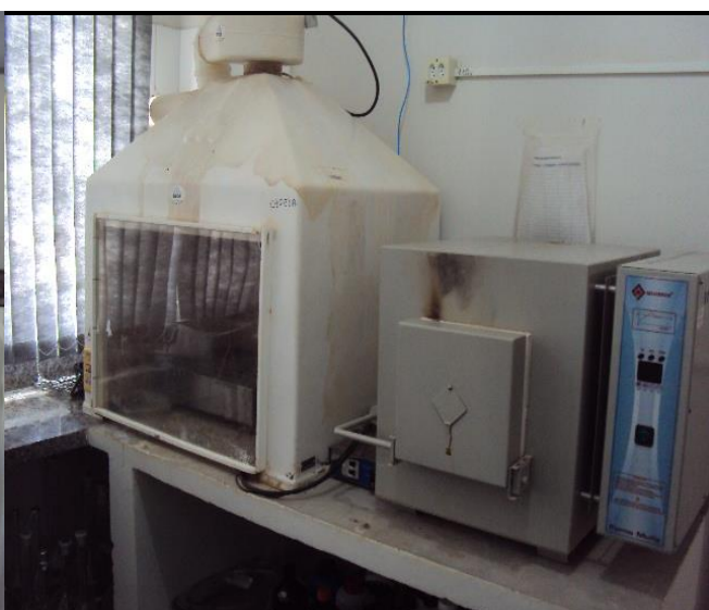
Laboratório de Análise de Alimentos e Nutrição Animal (LAANA)