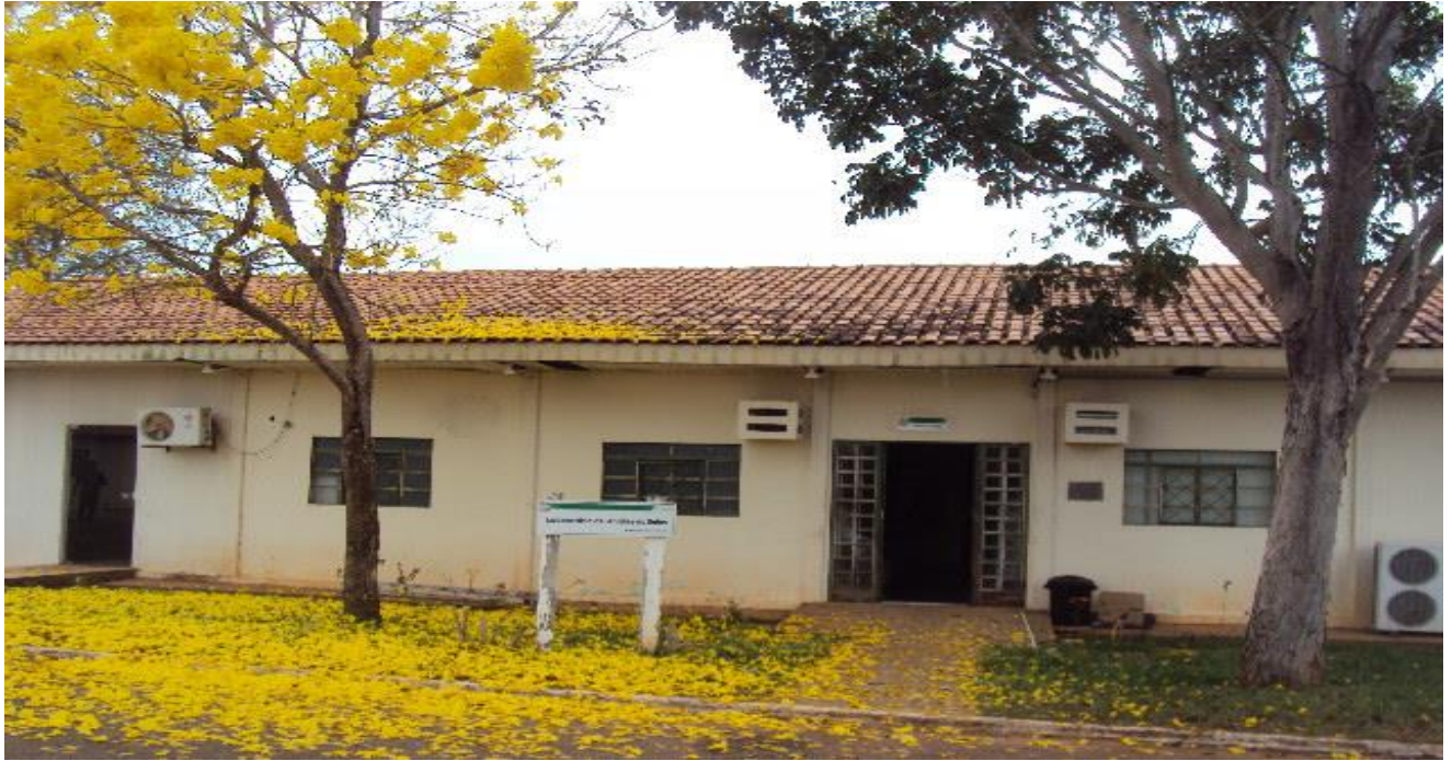
Laboratório de Solos II