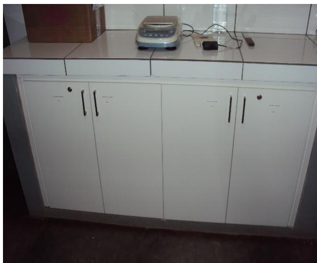
Armários com Chave