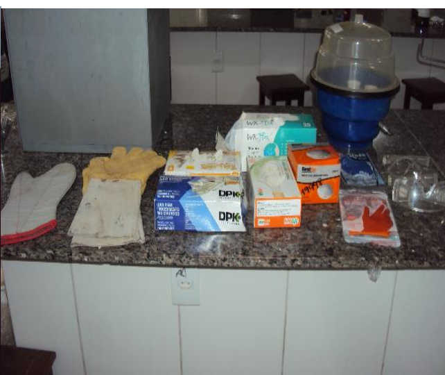
Equipamentos de Proteção Individual (EPI)