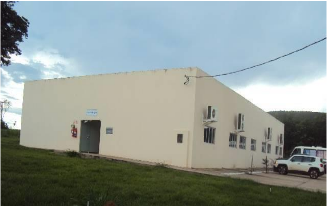
Laboratórios do Prédio do Centro de Pesquisa