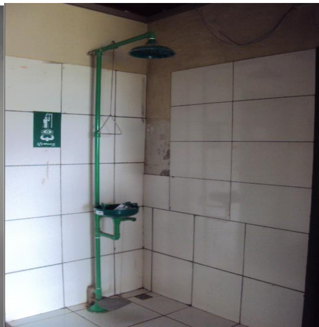
Chuveiro de Emergências