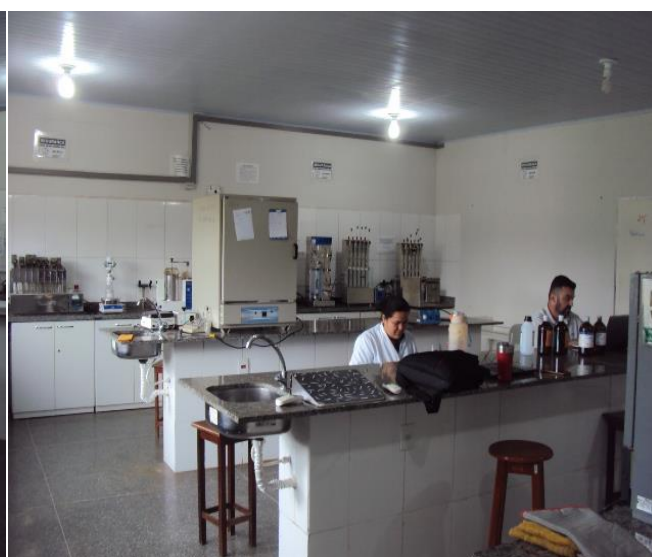
Laboratório de Análise de Alimentos e Nutrição Animal (LAANA)