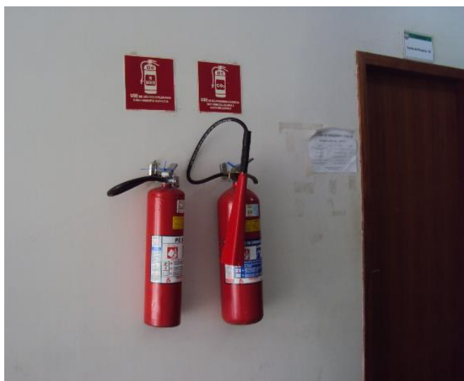
Extintores de Incêndio