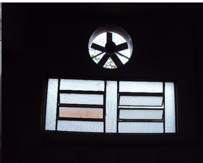
Sistema Exaustor de Ar