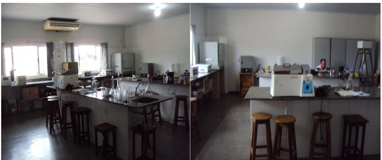
Laboratório de Solos