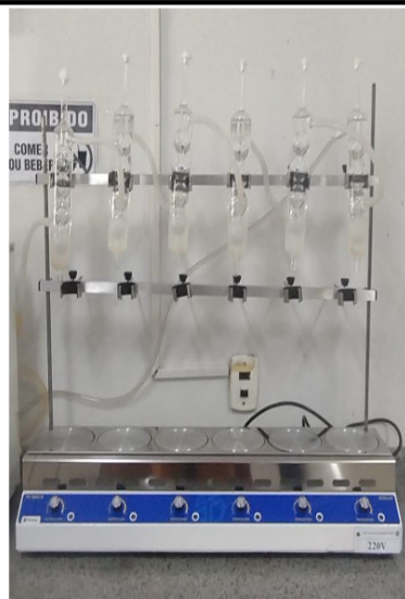
BATERIA DE EXTRAÇÃO 6 PROVAS SEBELIN