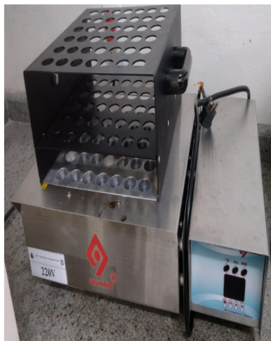
BLOCO MICRODISGESTOR 42 TUBOS