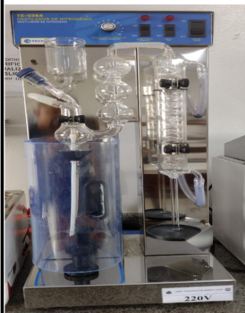
DESTILADOR DE NITROGÊNIO