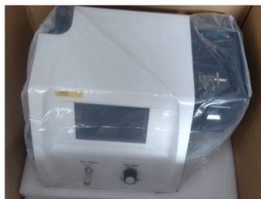
FOTOMETRO DE CHAMA