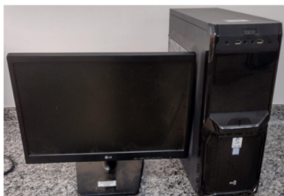
CPU E MONITOR