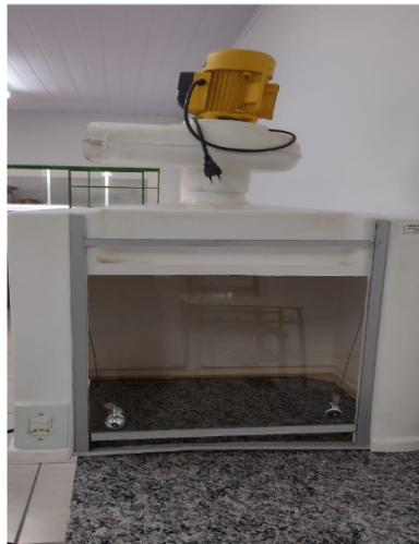
CAPELA DE EXAUSTÃO