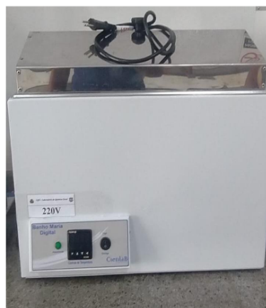
BANHO MARIA TERMOSTÁTICO