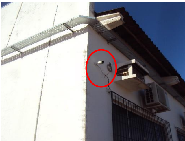
Câmeras de Vigilância