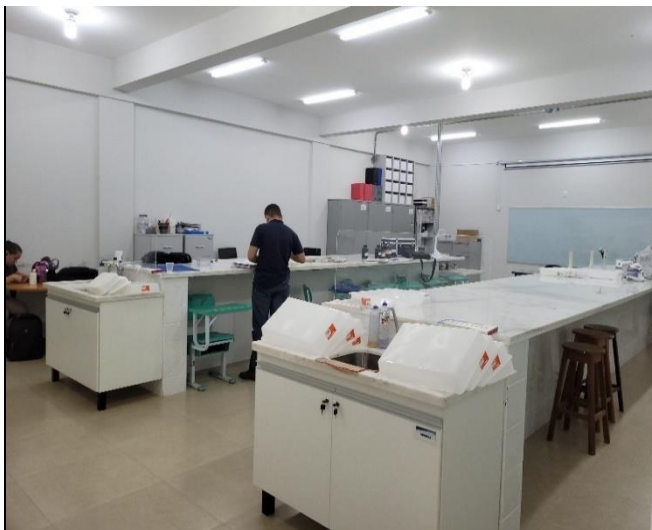
Laboratório de Sementes