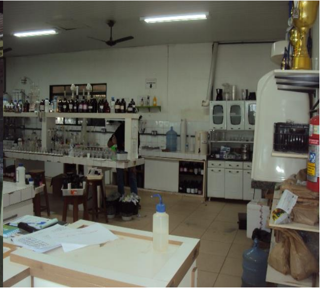
Laboratório de Análise de Solo (Vista Interna)