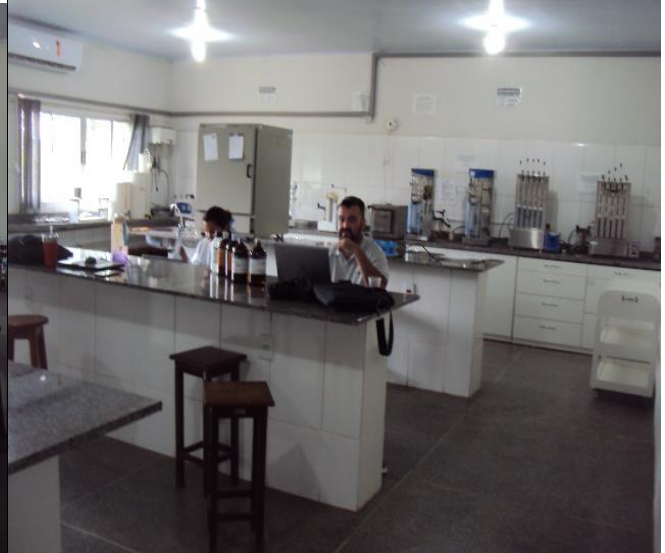
Lab. Análise de Alimentos e Nutrição Animal