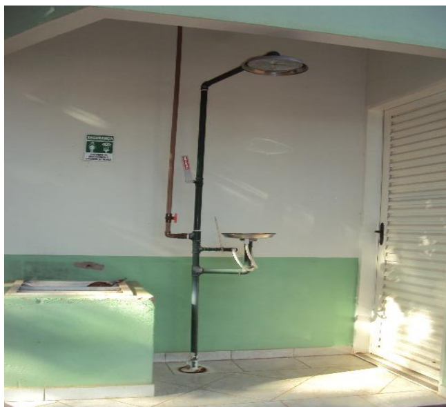
Chuveiro de Emergências