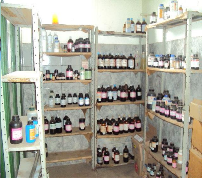
Depósito de Químicos (Vista Interna)