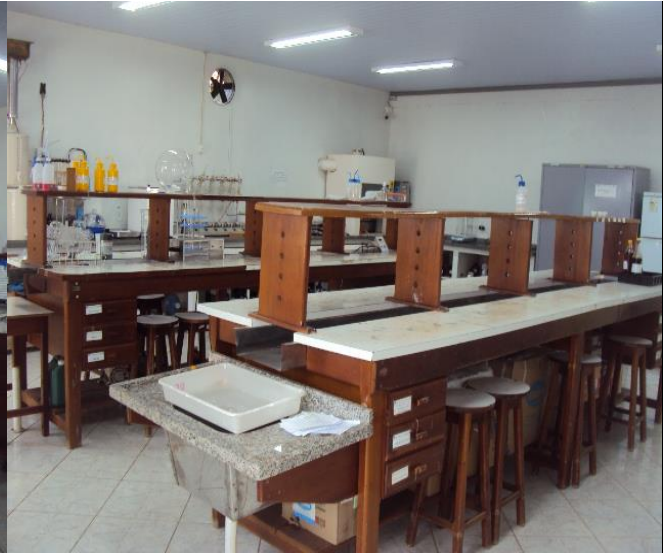
Laboratório de Química