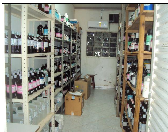
Almoxarifado de Químicos