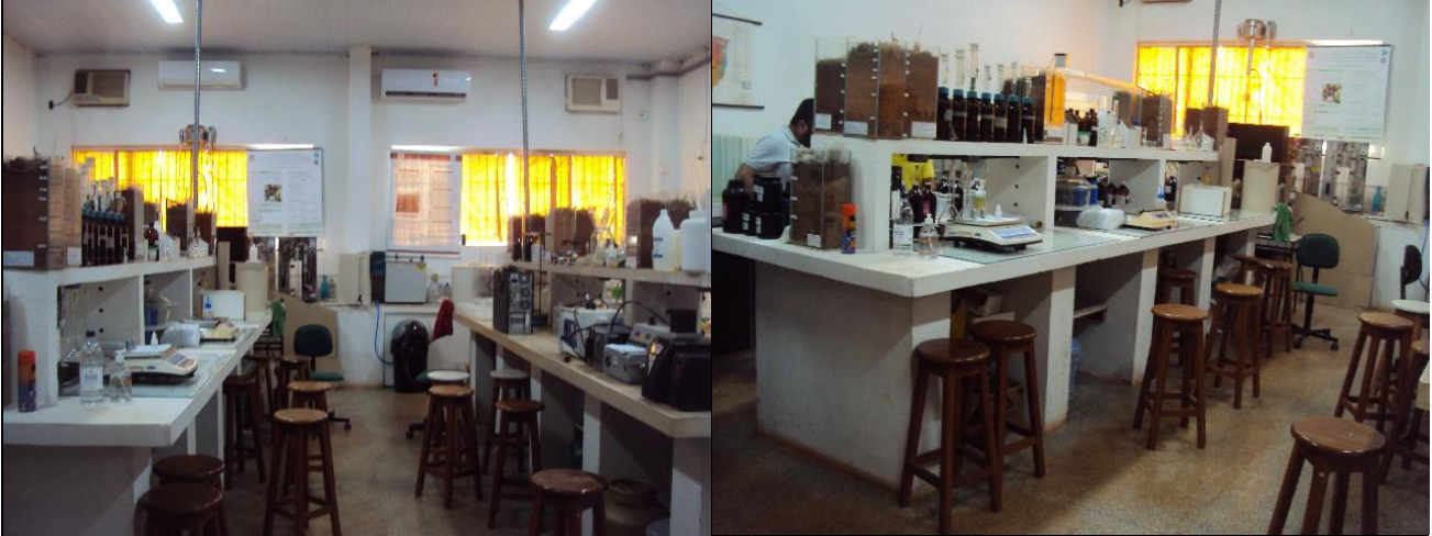
Laboratório de Solos