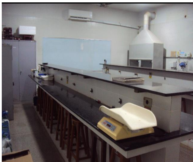
Laboratório de Química