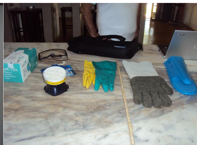
Equipamentos de Proteção Individual (EPI)