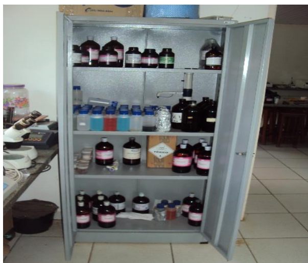
Laboratório de Solos