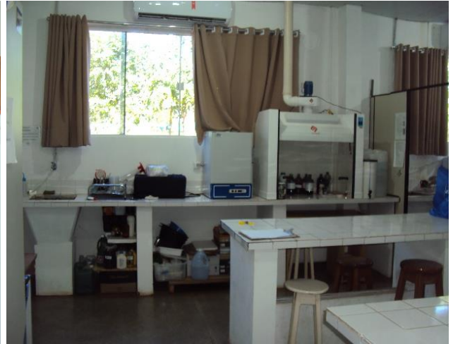
Laboratório de Anatomia Vegetal