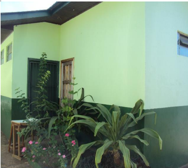
Depósito de Químicos (Vista Externa)