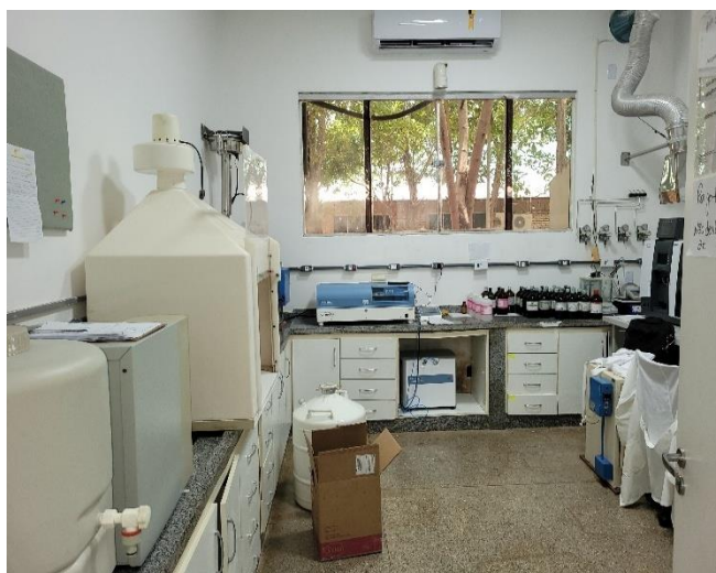
Laboratório de Ecotoxicologia