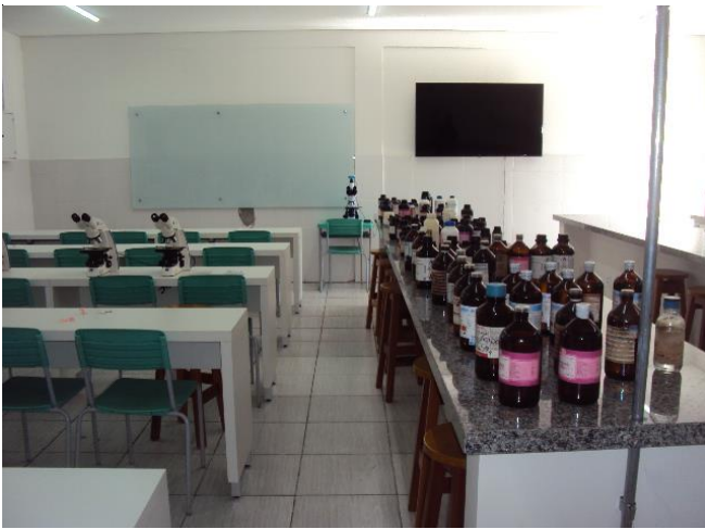
Laboratório Didático I