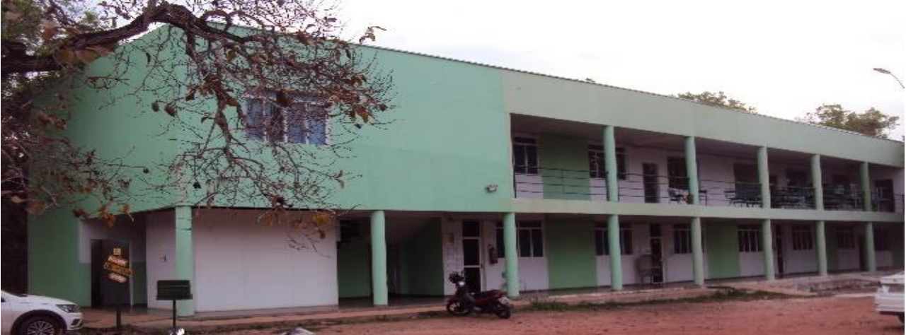
Campus Universitário de Nova Xavantina (Bloco Salas de Aula e Laboratórios)