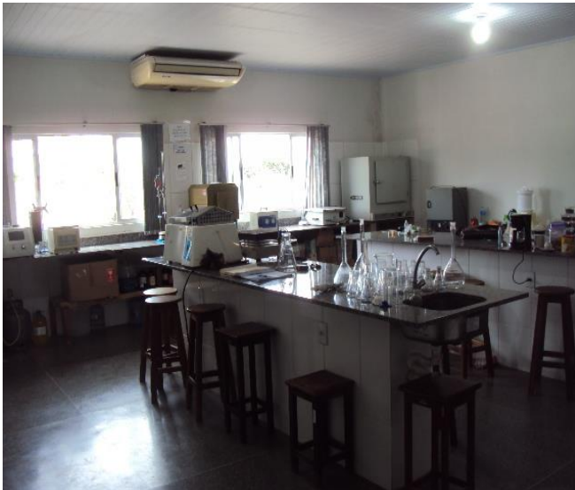
Laboratório de Solos