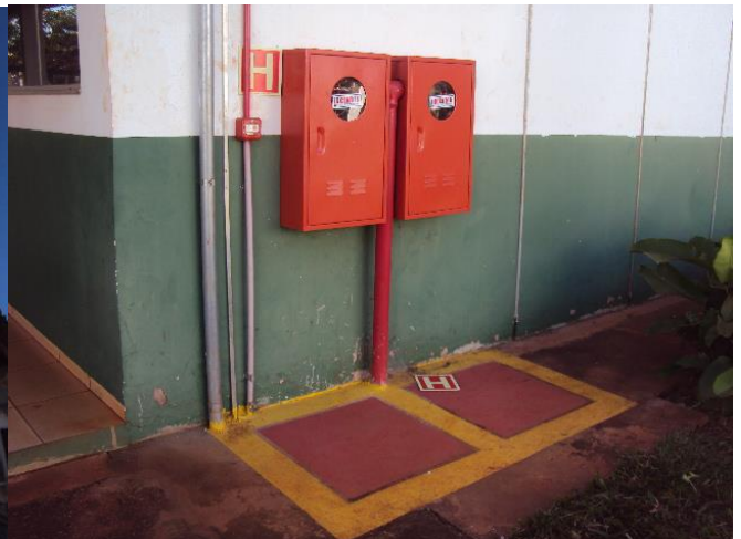
Rede de Hidrantes (PSCIP)