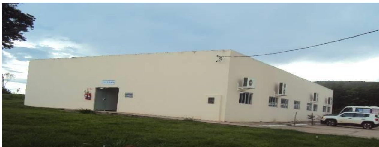
Prédio do Centro de Pesquisa