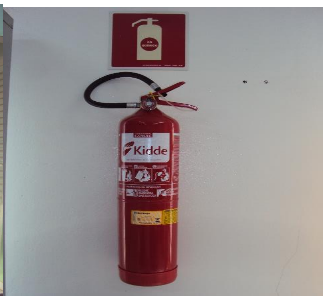
Extintores de Incêndio