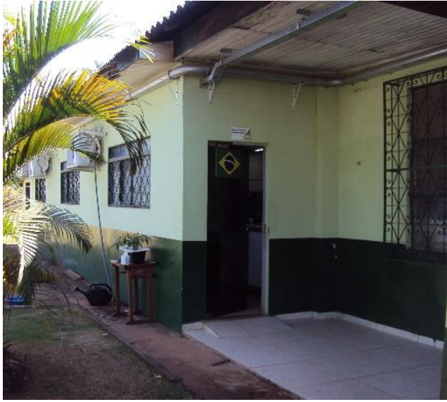
Laboratório de Análise de Solo (Vista Externa)