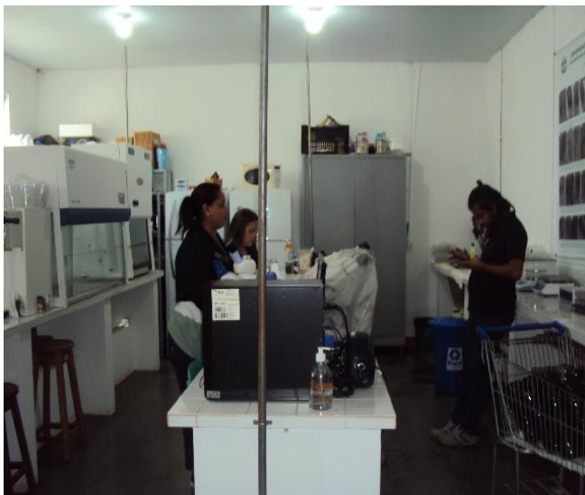
Laboratório de Citogenética