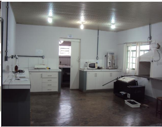
Armários com Chave