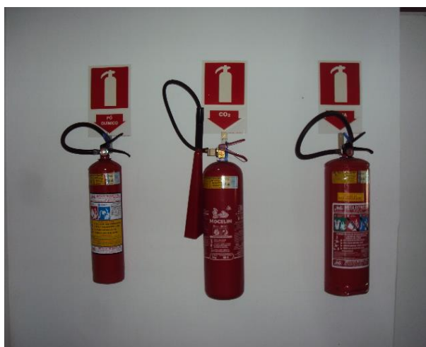
Extintores de Incêndio