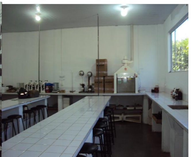
Laboratório de Silvicultura