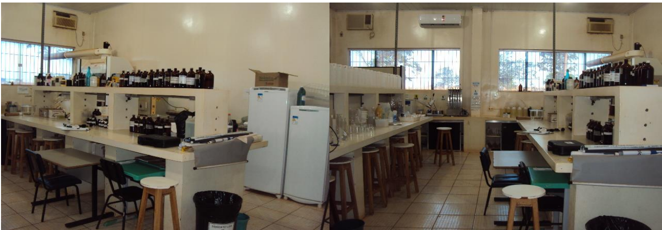
Laboratório de Química