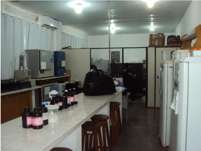
Laboratório de Sementes