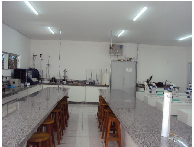
Laboratório Didático II