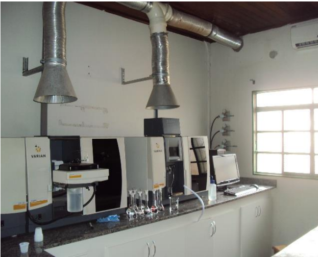
Laboratório de Solos II