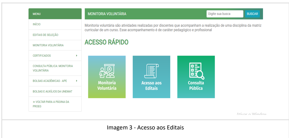
Imagem 3 - Acesso aos Editais

Na página da Monitoria, clique em ACESSO AOS EDITAIS (imagem 3).