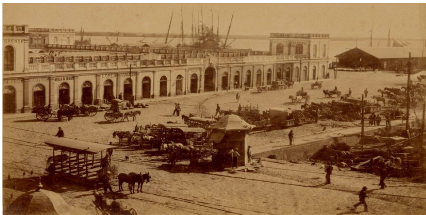
Imagem 02. Região do Mercado Público Central de Porto Alegre no século XIX

Disponível em: https://www.ufrgs.br/jornaisliterarios/acervodigital/porto-alegre-no-seculo-xix/foto-697f/ . Acesso 25 Fev.2018.