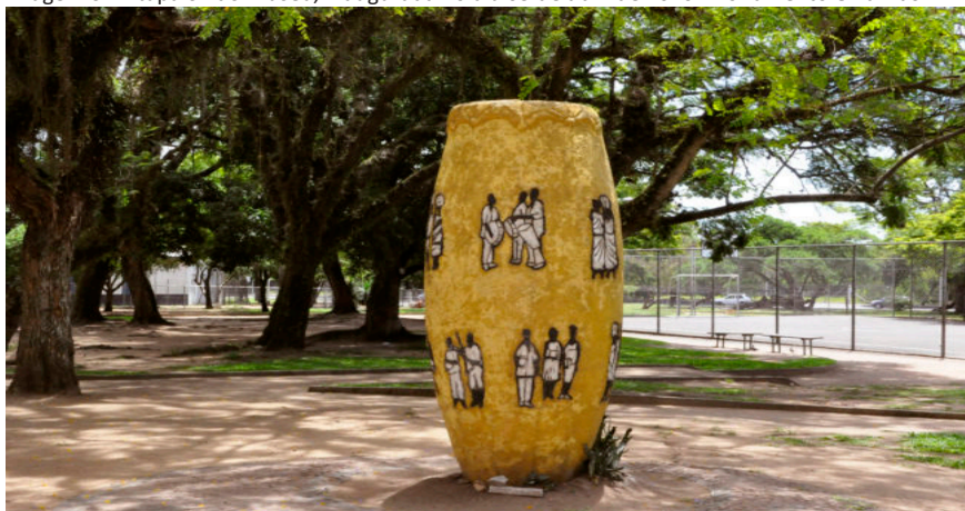
Imagem 01. Etapa 01 do Museu, inaugurada no dia 09 de abril de 2010. Monumento O Tambor

Disponível em: < http://g1.globo.com/rs/rio-grande-do-sul/noticia/2016/11/museu-de-percurso-do-negro-resgata-memoria-e-territorios-em-porto-alegre.html >. Acesso 22 jan. 2018>.