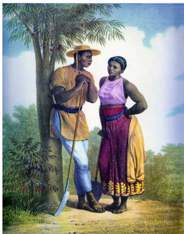
Voyage pittoresque ou Brésil , Johann Moritz Rugendas – Nègre & Nègresse dans une plantation, 1835 – Domínio Público