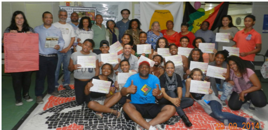
Imagem 04. Conclusão dos trabalhos com a entrega dos diplomas aos monitores quilombolas no dia 20 de setembro de 2014. Local, Secretaria Municipal da Juventude em Porto Alegre, RS.