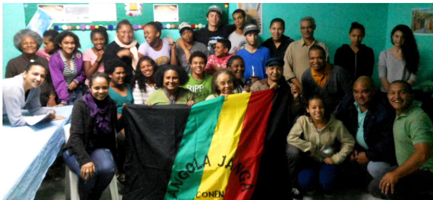
Imagem 03. Apresentação da 4ª Etapa do Museu na Sede da Associação do Quilombo do Areal

Disponível em: http://museudepercursodonegroemportoalegre.blogspot.com.br/p/arte-publica.html >. Acesso 11 Jan.2018.